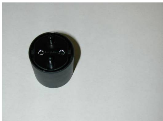
Übergangsstück CEE7-SEV Typ 11 Adaptateur CEE7-SEV type 11 Adattatore CEE7-SEV Tipo 11